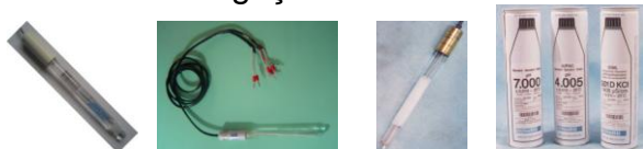
EC-209 cabo interligação ECT-209 padrões Equipamentos opcionais