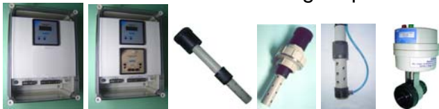
Caixa INP-24+91 INS-15 INS-16 LAV INP-65