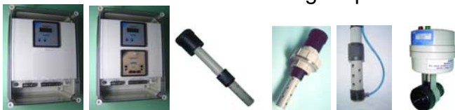
Caixa INP-24+91 INS-15 INS-16 LAV INP-65