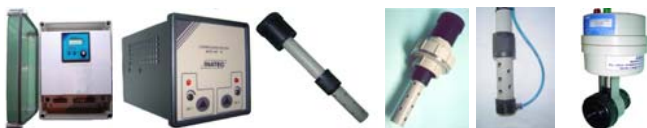
Caixa INP-91 INS-15 INS-16 LAV INP-65